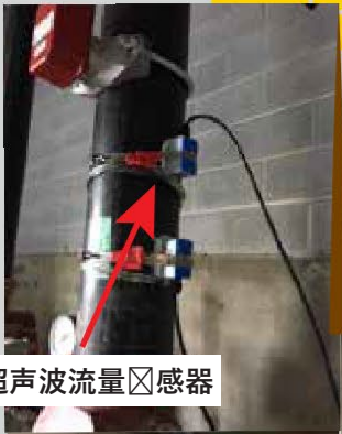
超声波流量传感器