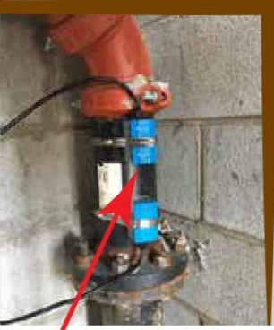
超声波流量传感器

水是施工期损失的主要原因，并且是建筑商（向保险公司）索赔的重要部分。由于很多漏水发生在工作结束之后，周末或没有人的时候，因此加用水或消防系统中的漏水导致多水。防止和/或减少水可以减少建筑商的索赔并防止目延误，最将使包括所有者在内的所有相关方受益，当然还包括承包商和保公司。